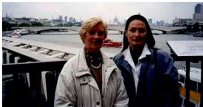
Лондон. На берегу Темзы