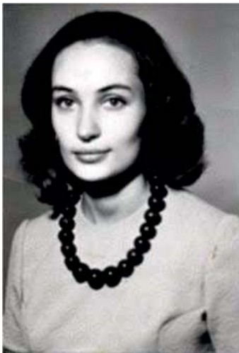
Первый год работы во Дворце пионеров и школьников

на несколько лет. Какая радость - заниматься любимым делом с детьми, которые проявляют настоящий интерес к обучению, к общению со сверстниками и с педагогами! Первые, самые трудные и важные шаги - овладение произношением и основами разговорной речи - проходят в игровой форме. Такие занятия пробуждают у детей интерес к изучению английского языка. Мои ученики любят петь английские песни, а я играю на фортепиано и на гитаре.